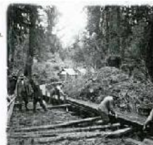
Un bosque en la localidad Chaparano, Región de Los Lagos. Muzard tomó esta foto en 1926.

Gracias al legado de la familia Muzard, el Archivo Fotográfico de la biblioteca