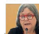
Diamela Eltit recibió el Premio FIL a la trayectoria.