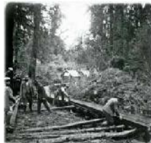
Bocanona de la canoa Km. 3 Rio Caualeo Chaparano XI. 1926

André Muzard, quien estuvo detrás del histórico negocio familiar, hizo miles de imágenes durante la primera mitad del siglo XX. Su registro aficionado es hoy un tesoro patrimonial.