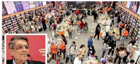
Sergio Ramírez inauguró la feria mexicana el sábado.

el régimen de Daniel Ortega. En esa misma inauguración, Eltit recibió el Premio FIL de Literatura por su trayectoria. En un discurso cargado de referencias a la contingencia política chilena, Eltit se declaró lectora de Juan Rulfo, pero sobre todo resultó a tres autoras mexicanas: Elena Carró, Elena Poniatowska y Margo Glantz (que recibió en la feria la Medalla Carlos Fuentes). “Después de décadas de habitar el espacio literario, me parece que es necesario desbiologizar completamente la letra”, apuntó. “Si cada generación piensa su propio apocalipsis, yo perteneceré a la que está protagonizando el terror climático”, dijo la escritora uruguaya Fernanda Trías, ganadora del premio Sor Juana Inés de la Cruz por “Mugre rosa”, novela escrita antes de la pandemia, pero que predijo la vida con el virus; es una historia sobre una ciudad confinada ante una enfermedad que se transmite por el viento. “El que hayas tenido experiencias trágicas no significa que te derroten”, dijo, en tanto, la prolífica escritora estadounidense Joyce Carol Oates, en una de las actividades virtuales de la FIL.